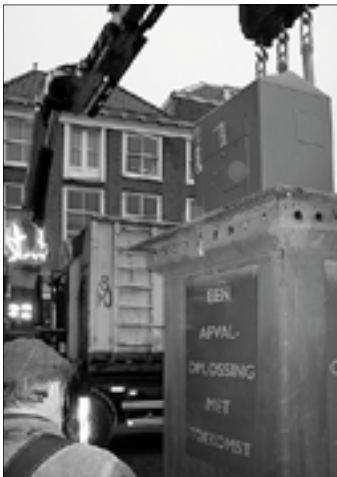
De glasbak wordt geleeagd.