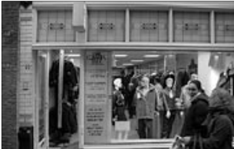
Het gerenoveerde pand Vlammingstraat 36 met slechts één deur.