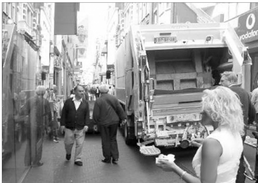
Het beeld, dat iedereen afkeurt, maar alleen weg te krijgen is met goede afspraken: vuilcontainers en ophaalwagens tussen het winkelen publiek.