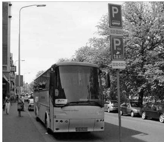
Nog is toeristisch Den Haag niet verloren. Een eenzame touringcar staat op 27 juni op de speciaal daarvoor ingerichte parkeerplaats aan de Prinsegracht.

"De gemeente is echter arrogant als zij denkt dat de rest dan vanzelf zal gaan. Want toeristen die de Haagse binnenstad per touringcar willen bezoeken, kunnen het vergeten.